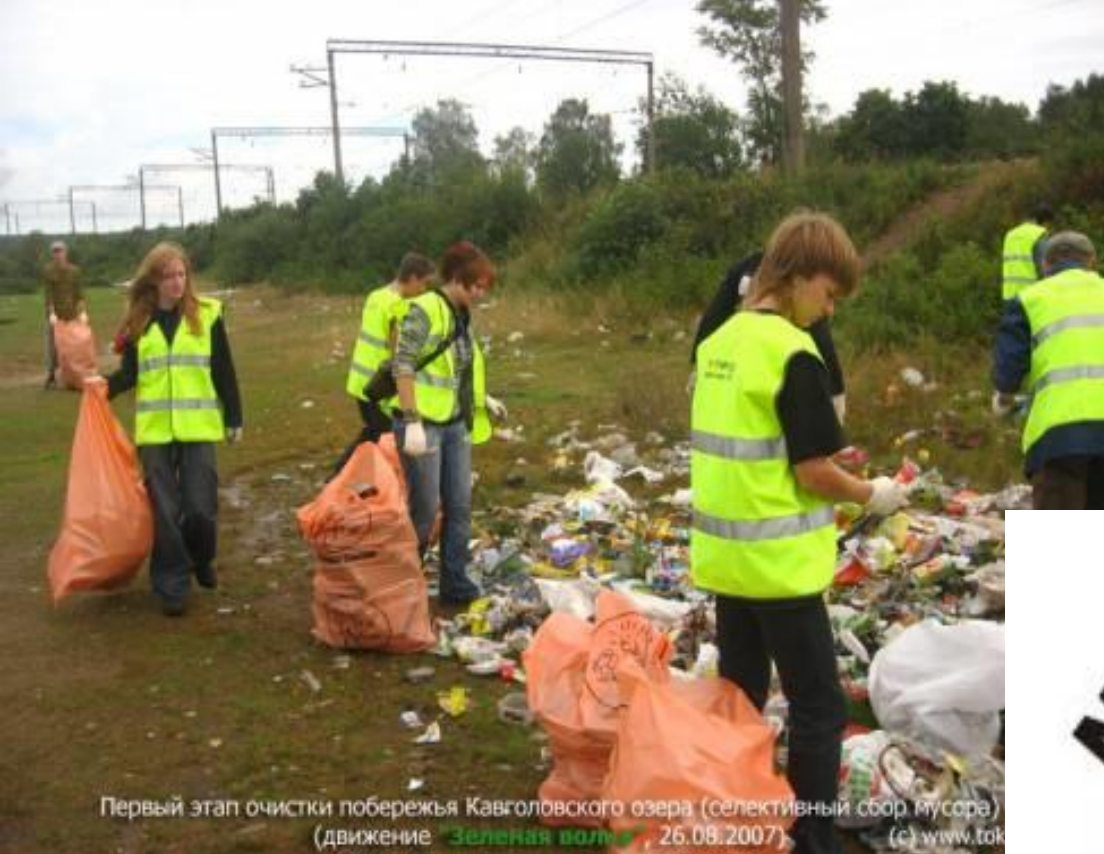
Первый этап очистки побережья Кавголовского озера (селективный сбор мусора) (движение Зеленая волна, 26.08.2007)