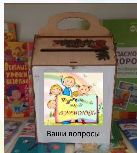
Собрание клуба «Секреты эмоционального благополучия»