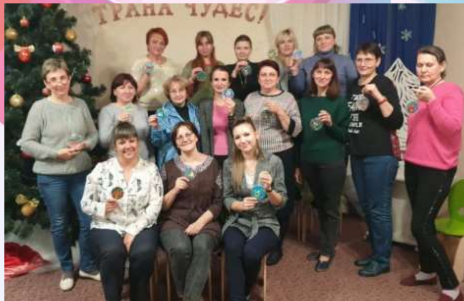
Мастер-класс «Обратная пластилинография»

Что лучше всего развивает и укрепляет взаимоотношения? Совместное творчество. А найти, чем заняться семейным вечером помогут мастер-классы!