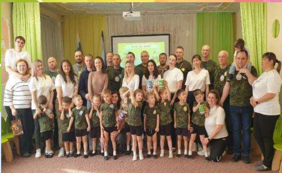
Развлечение в родителями «А ну-ка папы!»

Прыгать, бегать, веселиться, не тужить и не грустить – помогут развлечения, где соберутся вместе семьи, чтобы показать, что быстрее, сильнее, ловчее!