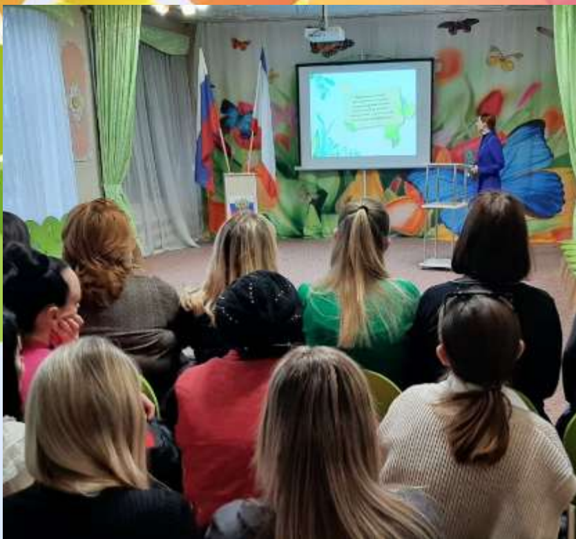
Консультация на тему «Развитие речи в семье»

Найти ответ на любой вопрос, получить совет от специалиста, отыскать решение любой проблемы помогут онлайн-консультации. В удобном формате, прямо на экране смартфона!