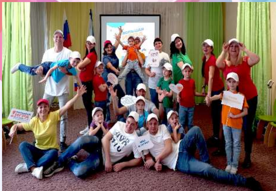
«Большая Игра им. Льва Выготского»

Познакомиться поближе, вместе идти к единой цели, вкладывать частичку своей души и таланта – все это в рамках участия в конкурсах!