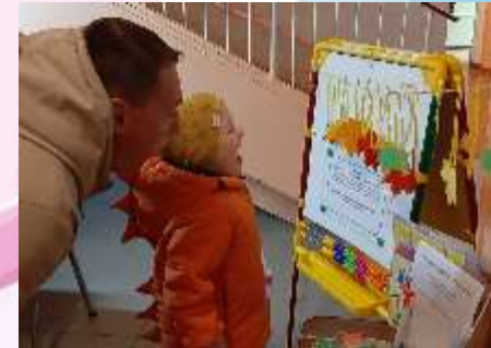
Логопедическая неделя «Лаборатория речевого развития»