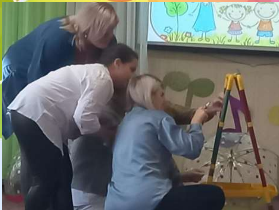
Викторина «Моя семья»

Показать свои знания и умения, проверить себя и узнать что-то новое помогут инновационные родительские собрания!