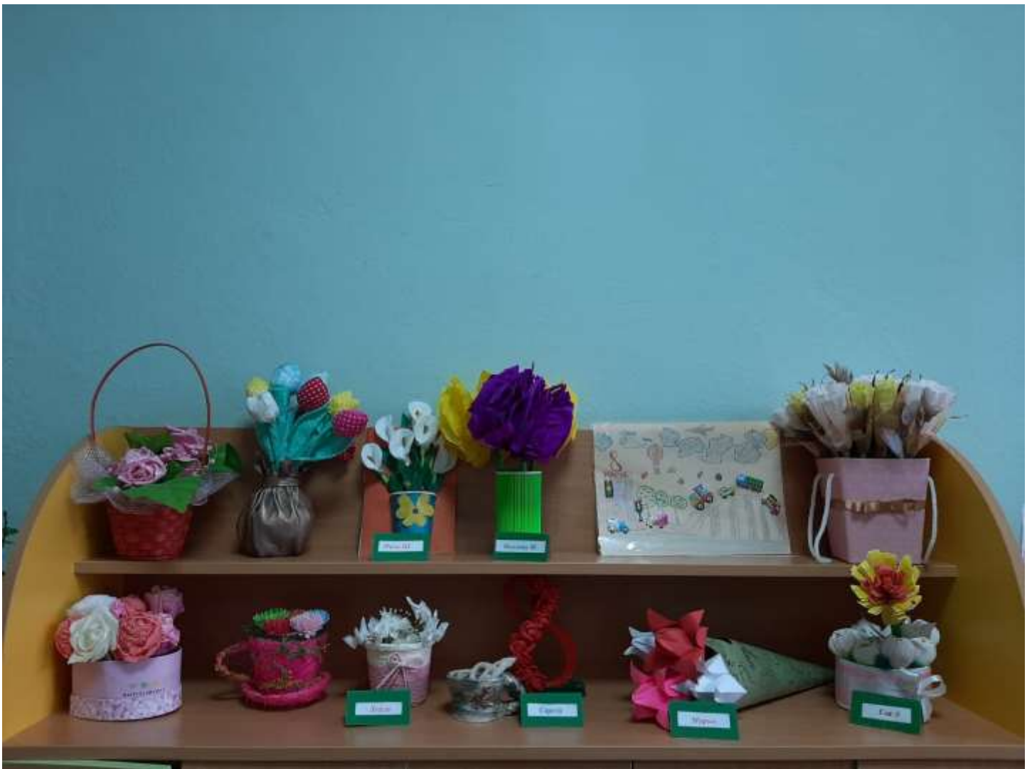
Выставка «Подарок для мамы»