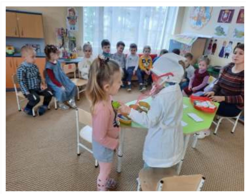
БЕСЕДА «ОПАСНЫЕ ПРЕДМЕТЫ»